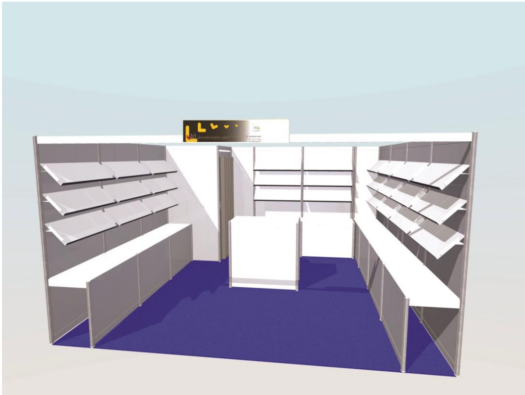
SKICA STOJNICE 1 s skladiščem